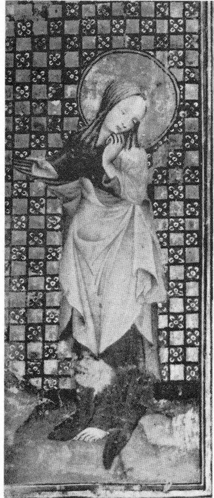
Missale voor bisdom Utrecht, ca 1400 (KB Den Haag, Hs. 128 D 29, fol. 128v, Canonplaat). DEN HAAG, Liturgische Handschriften .

Grote tentoonstelling die al eerder in Keulen te zien was (vgl. Bifolium 1). Ook beroemde handschriften zoals de boeken van Kells, Armagh en Durrow worden geëxposeerd. Uiteraard zijn slechts enkele bladen tegelijk zichtbaar, maar facsimile en video proberen het gemis op te vangen.